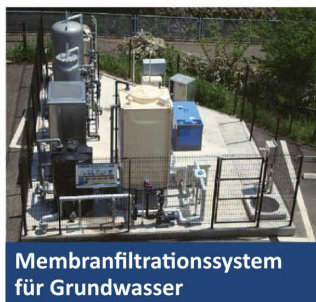
Membranfiltrationssystem für Grundwasser