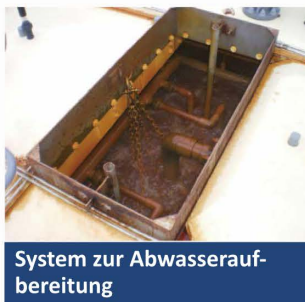
System zur Abwasseraufbereitung

Auf die Bedürfnisse des Kunden und die Rohwasserqualität zugeschnitten entwerfen wir kompakte Systeme und wählen geeignete Filtermembranen.