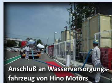
Anschluß an Wasserversorgungsfahrzeug von Hino Motors