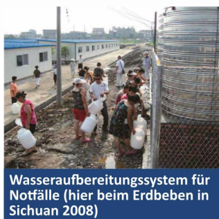
Wasseraufbereitungssystem für Notfälle (hier beim Erdbeben in Sichuan 2008)

Wir führen auch Abwasser-Recycling und sekundäre Aufbereitung von Anlagenabwässern mittels MBR, RO-Membranen u.a. durch. Nicht nur kann der Rohstoff Wasser somit wiederverwendet werden, auch wird ein Beitrag zur Reduzierung der Belastung der Umwelt und Verbesserung des hygienischen Umfelds geleistet.