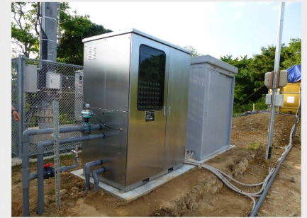
Grundwasser-Membranfiltrationsanlage des Mito Medical Center der National Hospital Organization