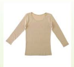
Frauen-Unterwäsche aus rundgeripptem Stoff mit Dreiviertel-Ärmeln