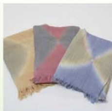
Mesh-gefärbte Stola mit zweilagigen Naturfaser-Garnen